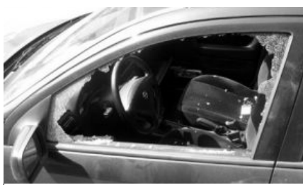
Un'auto con il vetro del finestrino in frantumi.

(Enzo) - Un'attività senza sosta, quella dei delinquenti. I quartieri semi-vuoti rendono tutto più "appetibile". I furti negli appartamenti l'hanno fatta da padrone un po' dappertutto. I ladri si sono spesso serviti di tubi Innocenti per far saltare le