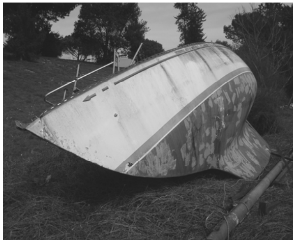
L'imbarcazione abbandonata nei pressi del Fosso

(Nostro servizio)- Cos'altro poteva capitare a Fonte Meravigliosa se non vedere, apparentemente abbandonata, una barca di circa 10 metri di lunghezza nel campo dove inizia il Fosso proprio ai piedi della collinetta denominata "Prato del Belvedere"? Forse nient'altro. Qualunque altra cosa accada, sarà difficile in