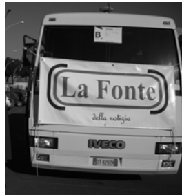
Il pullman del nostro CLUB

"Significa che...più che un "Malato" sarei un "Provolone Immaginario?" -sorride e precisa - ...fa solo parte del mio lavoro, altrimenti, chi glielo spiega a mia moglie che sta sempre dietro le quinte?"