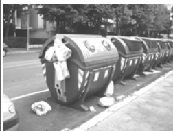
I cassonetti di via T. Arcidiacono

(Gico)- Evidentemente l'AMA non dispone di abbastanza uomini per controllare i cassonetti della città che risultano essere stracolmi di spazzatura. Di conseguenza, ha attivato un nuovo servizio per accogliere le segnalazioni dei cittadini che permettano di correggere tale problema. Sarà possibile