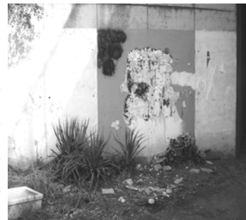
L'immagine della Madonna cancellata.

(Enzo)- Una celestiale immagine della Madonna, dipinta anni fa sul muro laterale del breve tunnel sotto il Gran Raccordo Anulare nei pressi di Castel di Leva, era stata grattata via da ignoti e senza alcun apparente motivo. Dopo un'intera estate, ad ottobre, finalmente è tornata al suo posto. Infatti, fra la soddisfazione generale, l'ignoto artista ha ridipinto la Madonna che ora è lì, ad infondere fiducia e coraggio nel cuore di tutti coloro che passando le daranno uno sguardo ed un saluto.