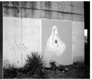
L'immagine della Madonna com'è ora.